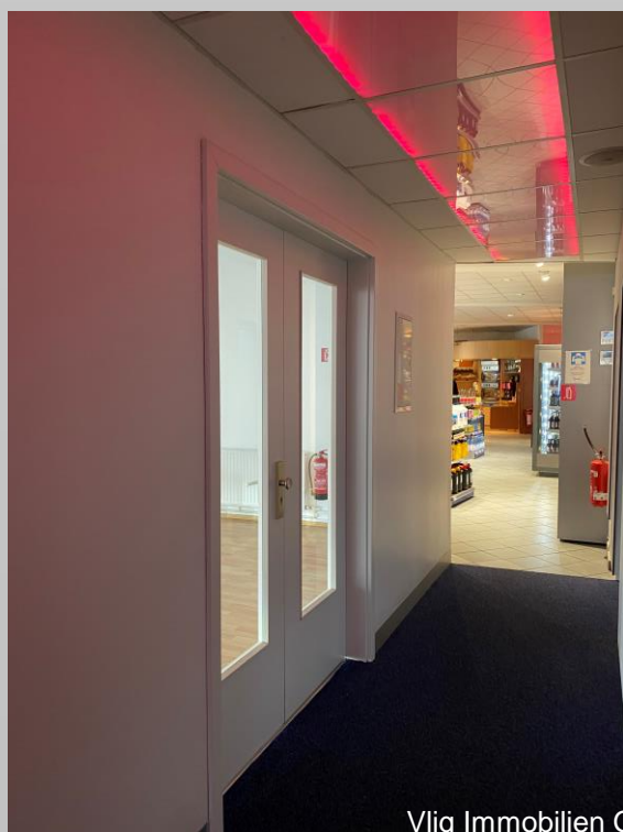
Personalausgang Kundendurchgang Waschstraße - Tankstelle

Vlig Immobilien GbR Lilienthalstraße 6 12529 Schönefeld Tel.: 030-6322 4545 Fax: 030-6322 4575